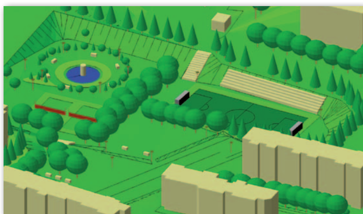
Rys. 1. Przykłady wizualizacji danych przestrzennych w systemie GEO-MAP